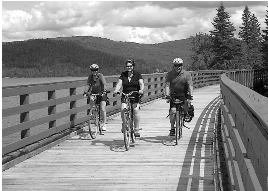
Les passerelles du Petit Temis sur le lac Témiscouata.

Voilà donc notre « véloscapade » de cette année. L'an prochain ce sera probablement une tournée au lac St-Jean où on parle déjà de la création d'une navette comparable à la nôtre.