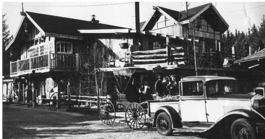
La Butte à Mathieu, rue Monty, du temps de sa splendeur (1963).